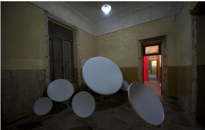
Paraboles Installation Antennes paraboliques, vernis polyuréthane.