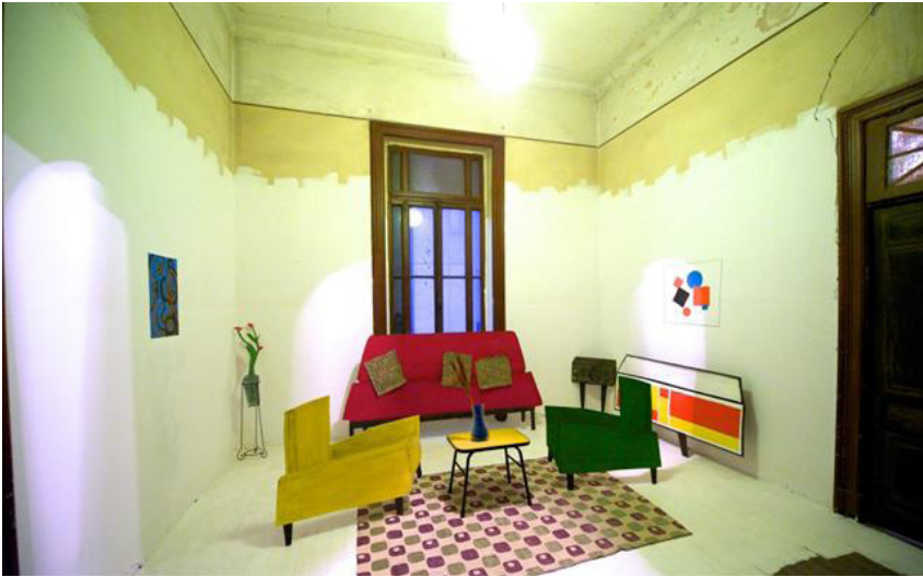
Pop-Up 50 Installation, Peintures sur mdf découpé, installées dans une pièce badigeonnée de blanc. Table basse, vase en plastique, fleur séchée, tapis, socle pour vase, 2 peintures murales, plafonnier.