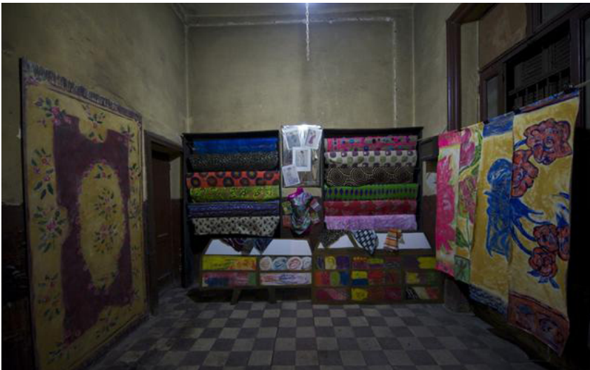
Pop-Up Bout du rouleau Installation, Tapis et tissus d'ameublement, toile, plastique, peinture à la colle, mdf, vinyl, gouache, gravures de mode, mannequin, foulards