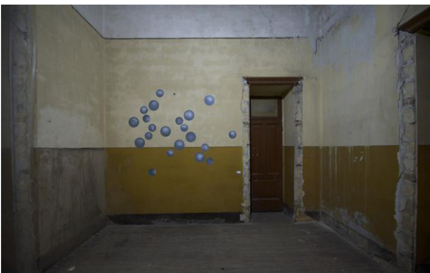
Blindness Installation, Tirages photographiques numériques, verres dépolis