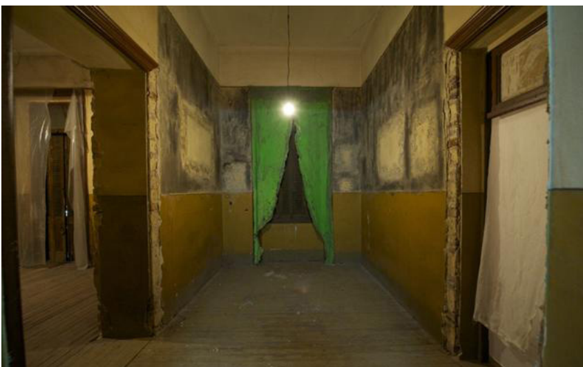
Le rideau vert Installation, Poussière, colle, peinture, bâche en plas- tique peinte et découpée, ampoule.