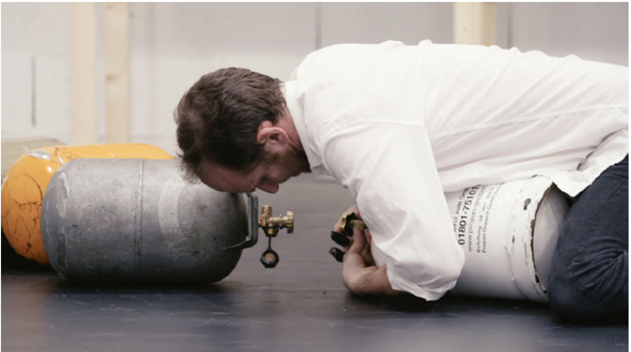
LA LUTTE

LA LUTTE est un instant performatif qui pour sa réalisation nécessite l'appel de pulsions et de sentiments complexes : l'agressivité, la violence, la froideur face à un geste décidé mais aussi le dépassement de soi et la détermination personnelle face au regard des autres.