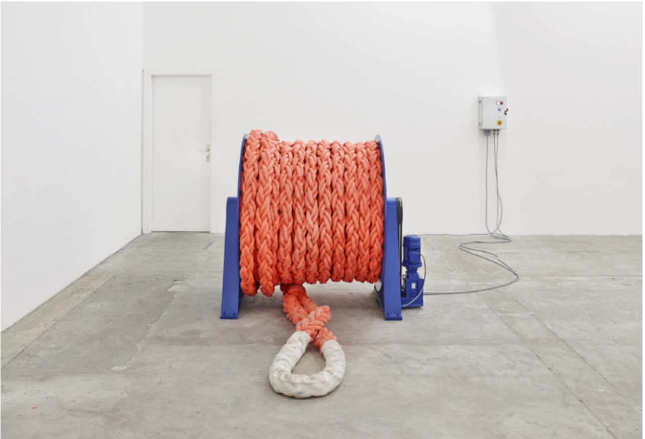
SELF © D.Gagnebin-de-Bons